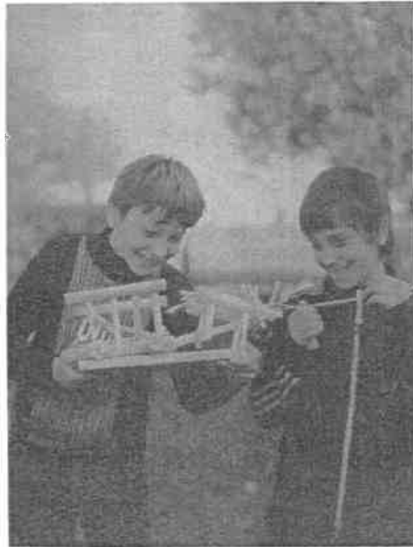
Ilyet már nem lehet látni! De valaha hasonló szekéren szállították a kukoricát, közlekedtek a helybéliek