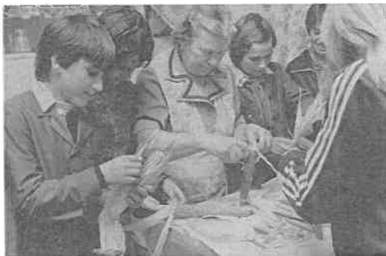
Vitéz néni azonnal megmutatta, miként lehet a csuhéból, kukoricabajusból a csutkababának haját fonni