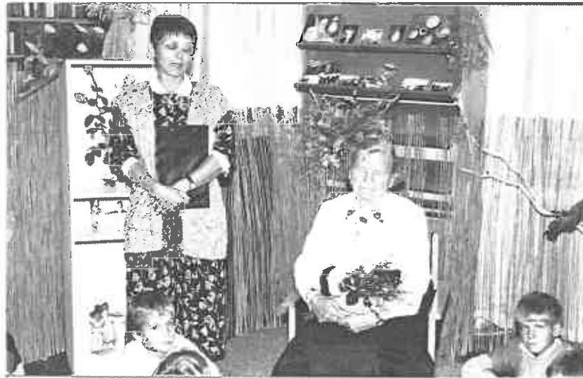
Vitéz néni a könyvtárban