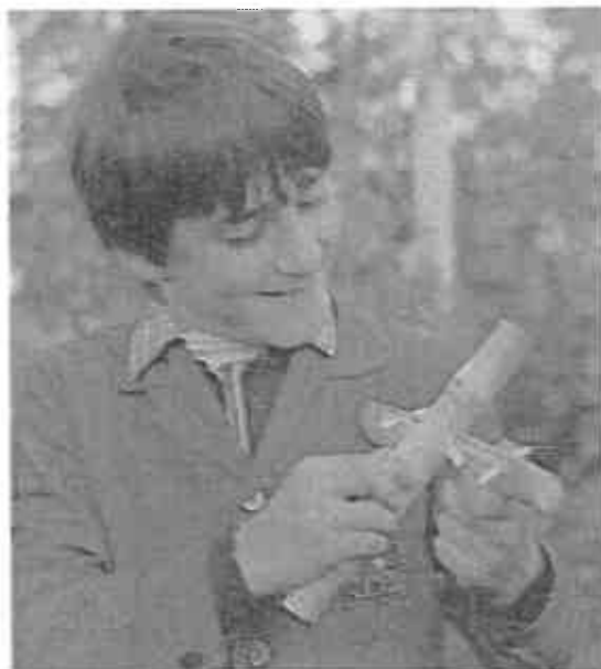
Cini-cini hegedű, itt minden kukoricaszár muzsikál