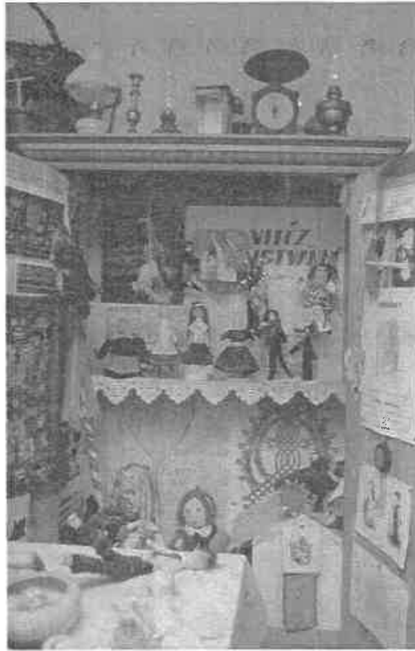
Vitéz néni játékszekrénye