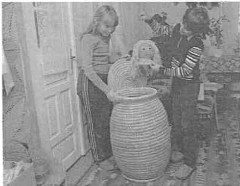
Ebben el is lehetne bújni. Vitéz néni büszkesége az óriás kosár