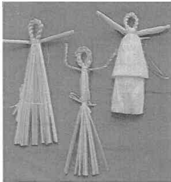
Babatánc. Vitéz néni minden babája kincs, kedves játék