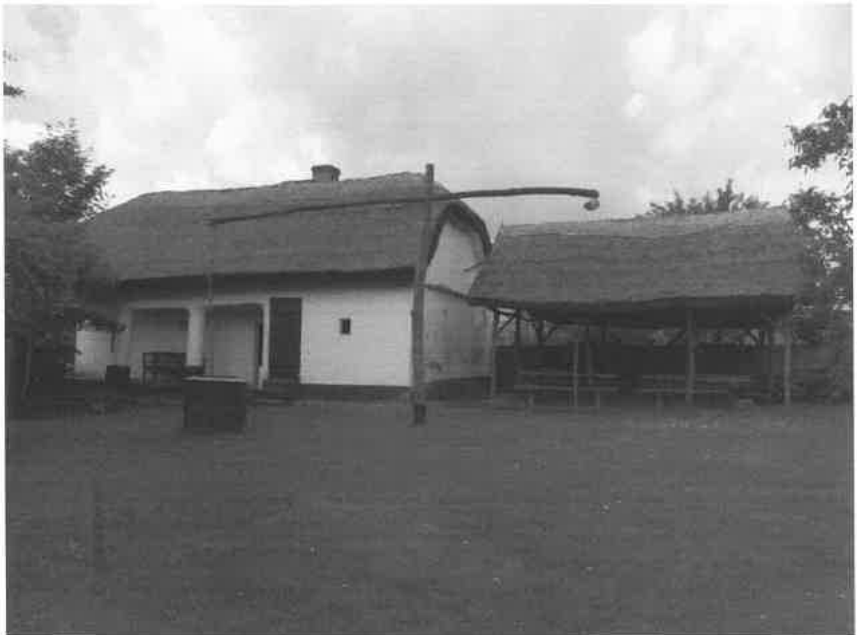
A Tájház udvar felőli nézete a színnel, valamint a tornác és a búbos kemence

1. Az értéktárba felvételre javasolt nemzeti érték fényképe vagy audiovizuális-dokumentációja: