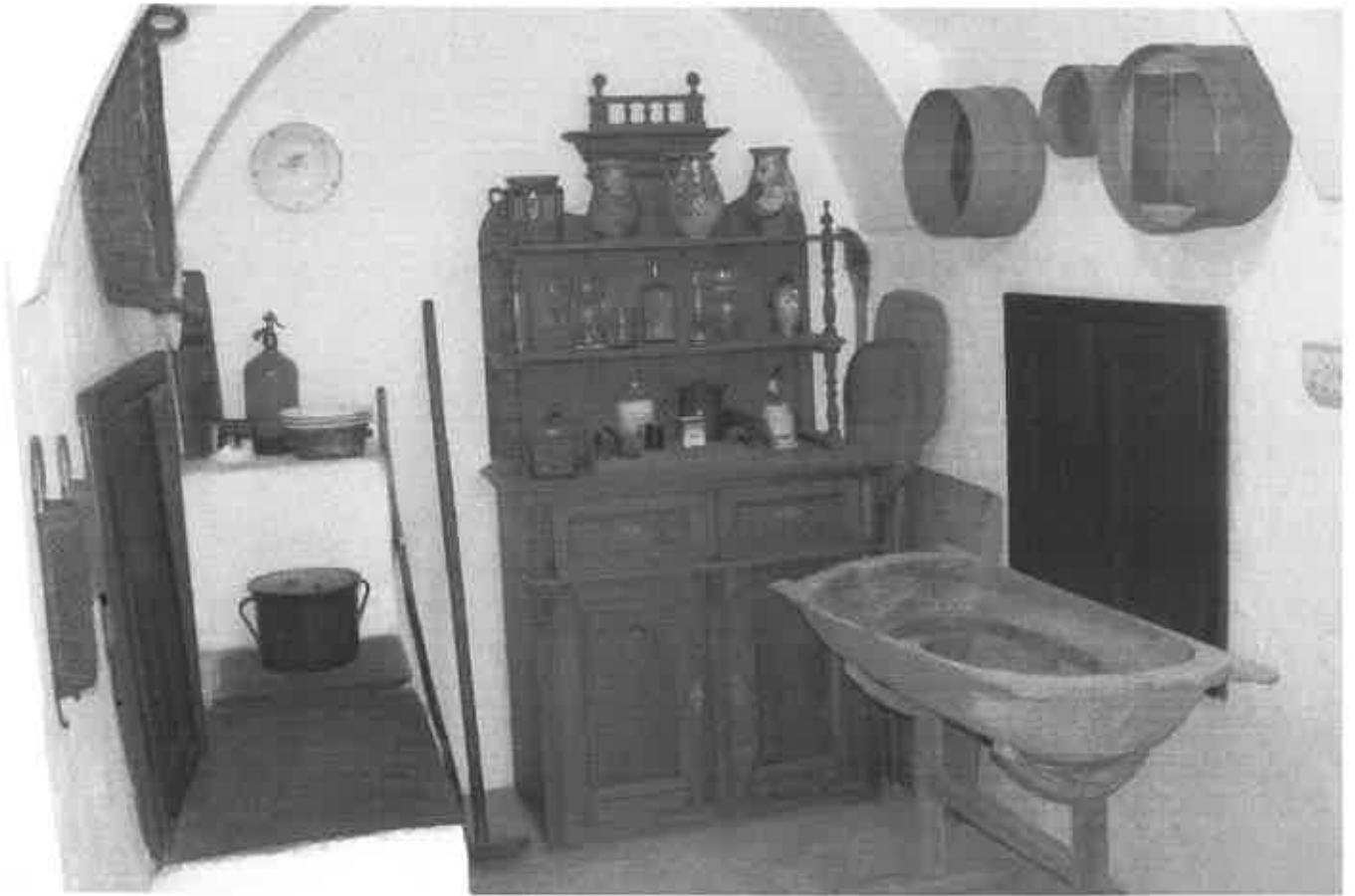
A pitvar berendezése és a ház alaprajza