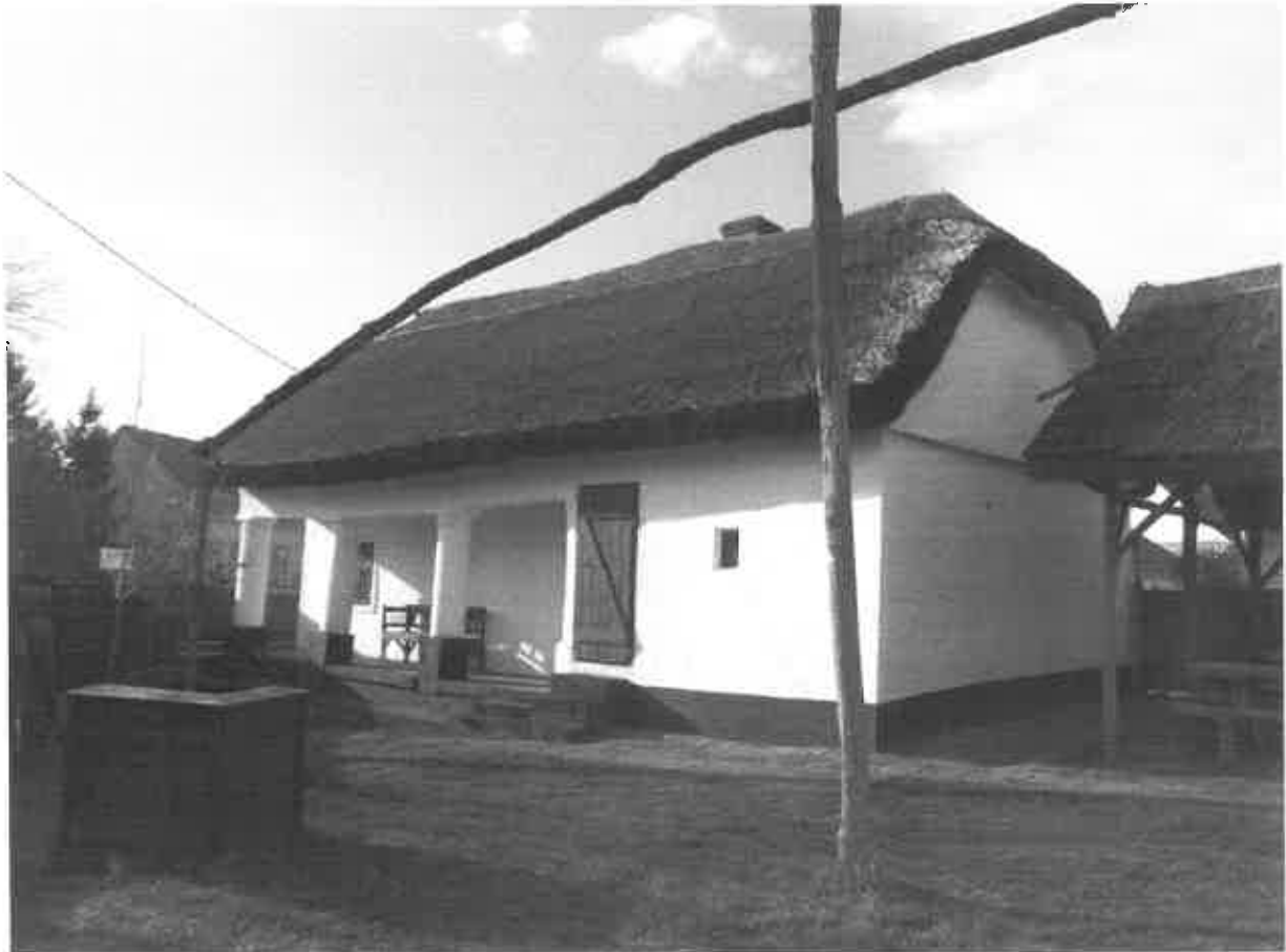
A Tájház épülete a kútágassal és kúttal, lenn a nagyház berendezése