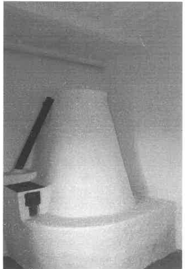
A tornác a búbos kemencével, valamint részlet a nagy házból