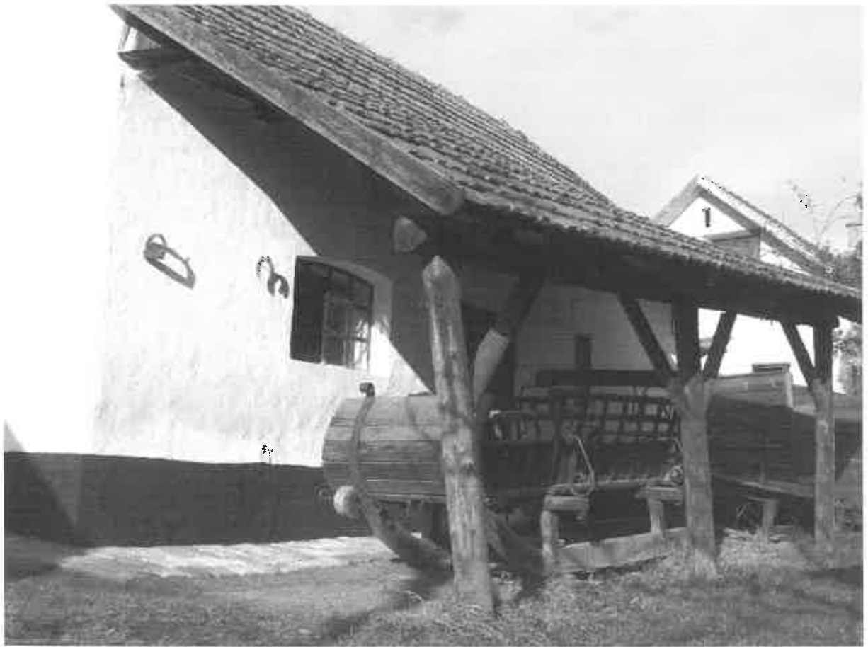
Az istállóból átalakított kovácsműhely a támasztott eressel és berendezésének egy részlete