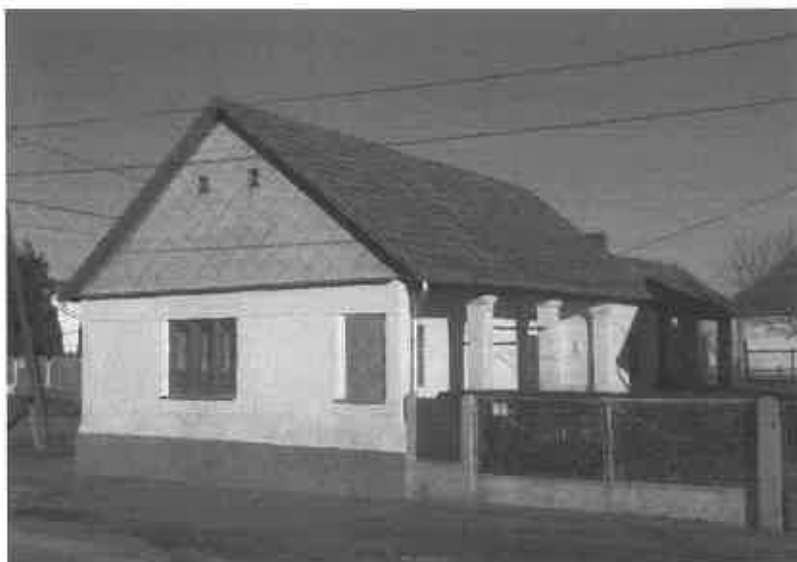
Nagy Ernő egykori lakóháza a Perczel utca 12. szám alatt