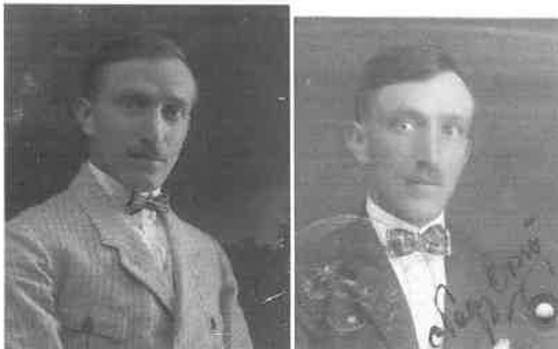
Arcképek az 1920-as évek végéről és az 1930-as évek elejéről