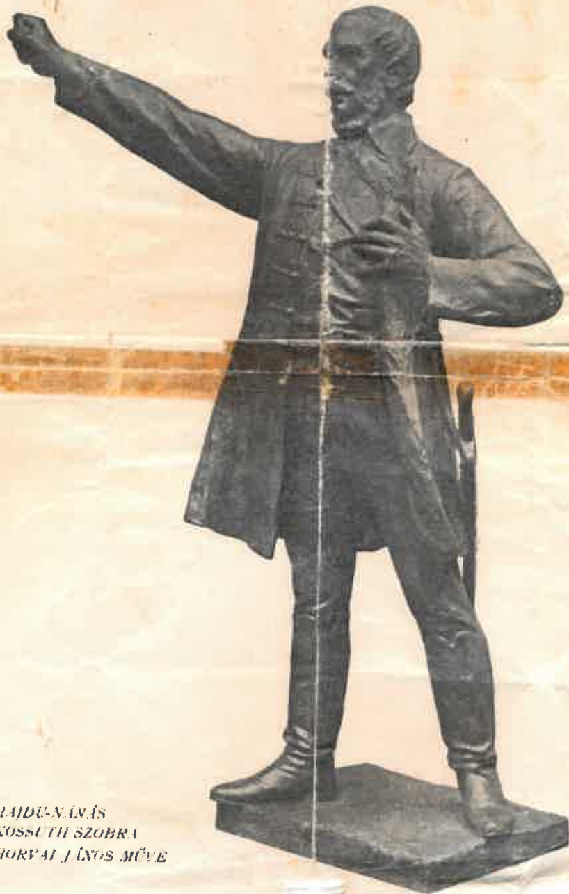
ԿԱՅՉՈՒ-ՈՒՅՆԱՆՆԵՆ KOSSUTH SZOBRA HORVÁI JÁNOS MŰVE