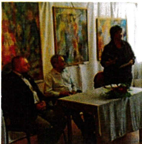
Tanulmánykötet Buczkó József néprajzkutató tiszteletére - könyvbemutató