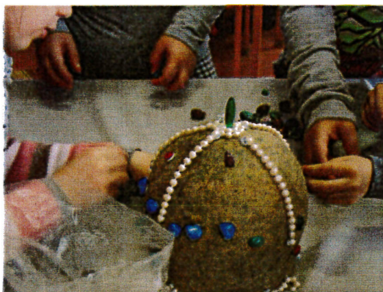
Bocskai korona foglalkozás