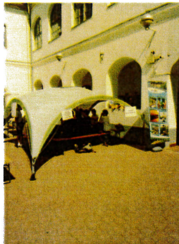
Becsengettek - Hajdúsági Múzeumban