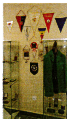
Hódos Imre kiállítás részlet