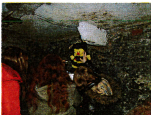
Múzeumok Őszi Fesztiválja - pincetúra