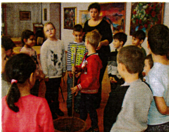
Fut-robog a kicsi kocsi - foglalkozás