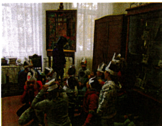
Márton napi foglalkozás