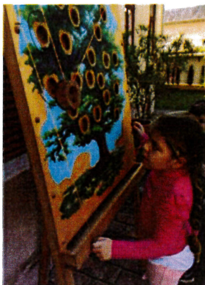
Régi idők játécai