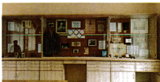
Hódos Imre kiállítás részlet