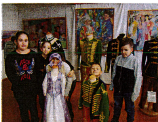
A katonai ruházattól az ünnepi viseletig