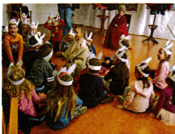
Márton napi foglalkozás