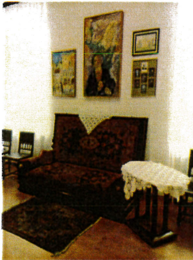
Pituk József Viktorián kiállítás részlet