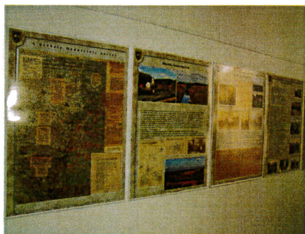
Székely hadosztály kiállítás részlet