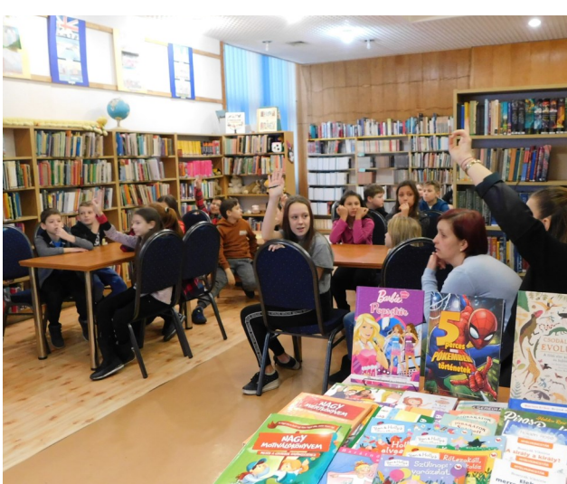
2020.01.23. Évszakok Bogyó és Babócéval