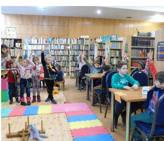
2020.01.15. A jómodor nem ciki