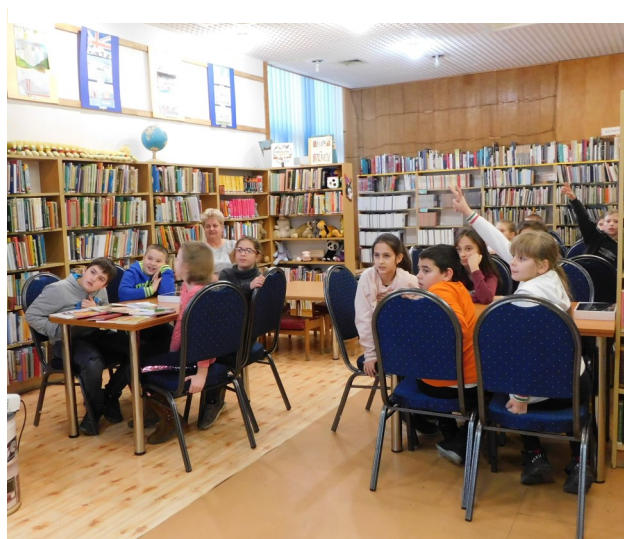
2020.01.17. A jómodor nem ciki - Netikett