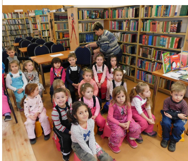
2020.01.23. | Mindentudók II. - Hungarikumok (3-4. osztály)