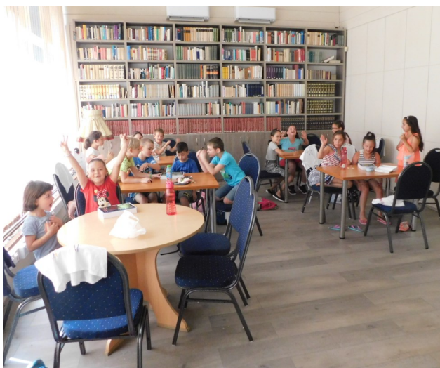
2020.07.14. Baba-mama klub