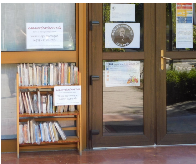
2020.05.11-18. Tündérlesen versmondó (online)