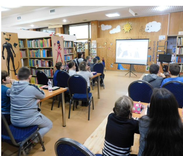
2020.01.24. | Mindentudók II. - Hungarikumok (5-6. osztály)