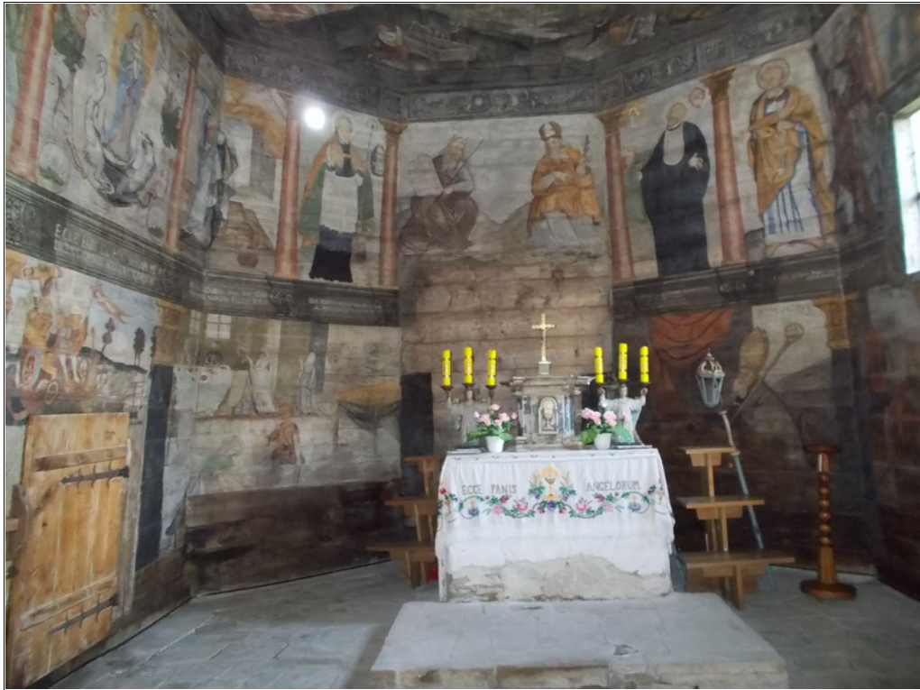
Újterebes (lengyelül Trybsz) Árpád-házi Szent Erzsébet templom (1567) Kívül és belül szépen felújítva

Térkép és a szepesi dokumentum forrása: internet Az újterebesi fotók a szerző felvételei