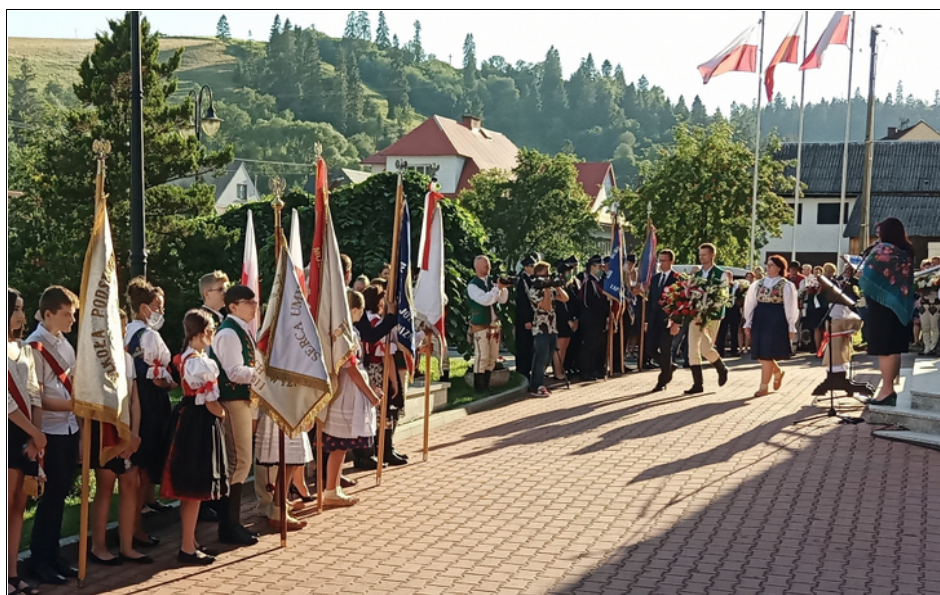
A lengyelországi szepesi községben Lapsze Nizne (Alsólápos) község különleges módon emlékezik meg Spisz (Szepes) Lengyelországba való visszatérésének 100. évfordulójáról

"A megosztó hatalmak bukása 1918-ban és a Lengyel-Litván Nemzetközösség újjászületése csak az államhatárokért folytatott harc kezdete volt. A Csehszlovákiával folytatott viták fő területei Zaolzie, Spisz és Orawa voltak. 1920-ban, amikor a bolsevik hadsereg Varsó felé közeledett, a lengyeleknek el kellett hagyniuk a népszavazás megtartásának tervét, és el kellett fogadniuk a Nagykövetek Tanácsának döntését. 1920. július 28-án csak egy tucat szepesi falut kaptunk. Czarna Góra, Dursztyn, Falsztyn, Frydman, Jurgów, Kacwin, Krempach, Łapszanka, Łapsz Nizne Łapsz Wyżne, Niedzica, Nowa Biała, Rzepisk és Trybsz."