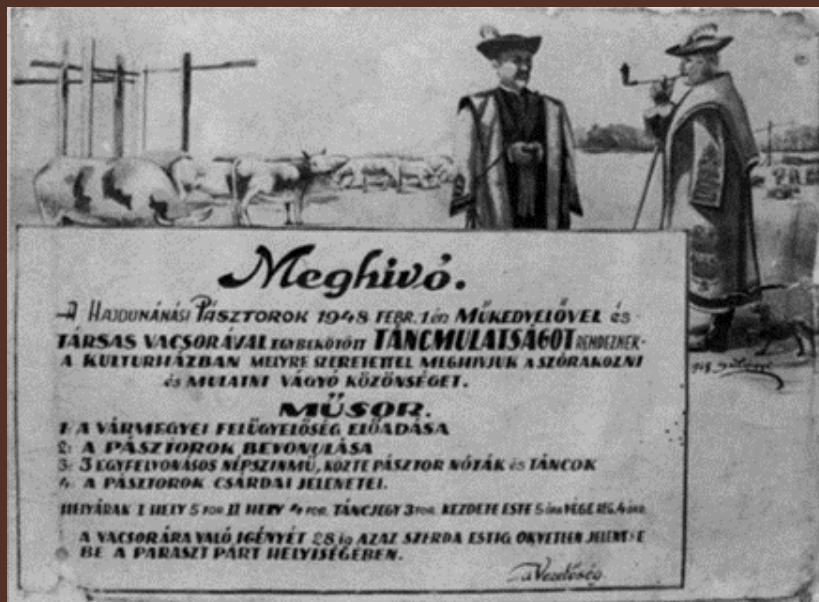
Hajdúnánás, 1948.