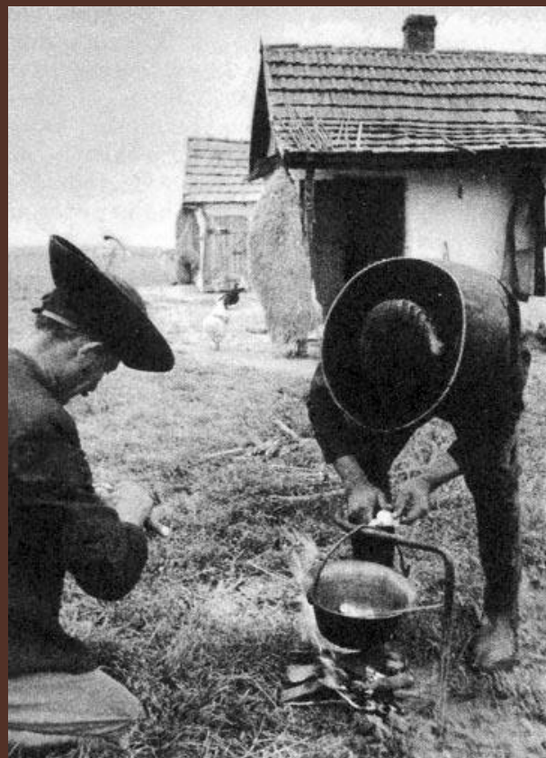
Bográcsban ételt főző gulyások (Hajdúnánás, 1980-as évek) /Néprajzi Lexikon/