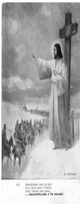
Jézus a hadi úton