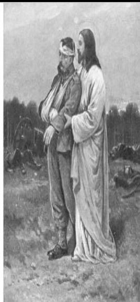
Jézus a fronton