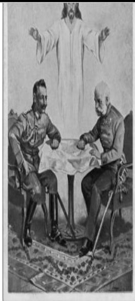
Jézus a hadvezetésben