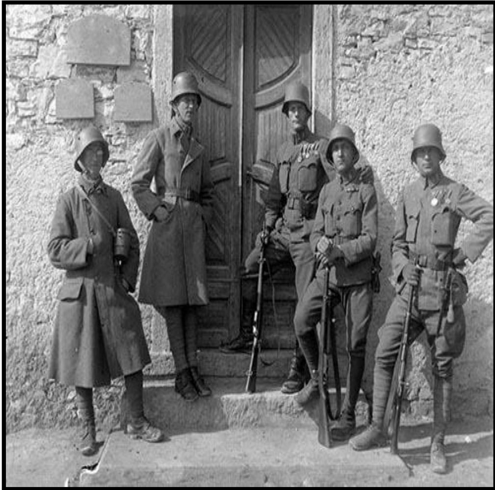
Katonák csoportja háború végi egyenruhában