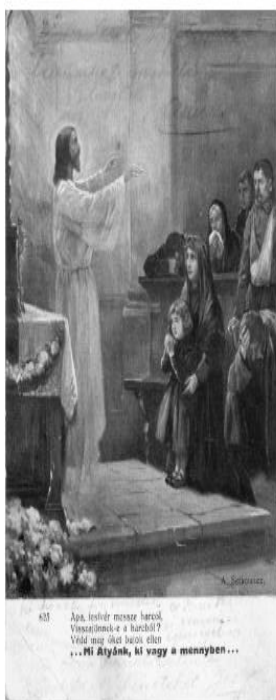
Jézus a hátszágban