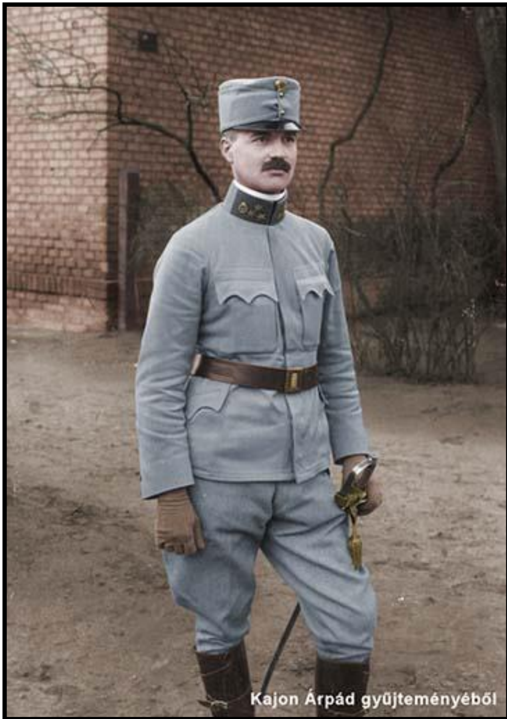
Az 1908-ban bevezetett csukaszürke színű egyenruha 56 .